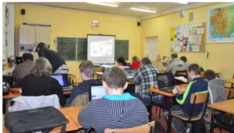
Na zdjęciu: Osoby zakwalifikowane do programu uczestniczyły w szkoleniach komputerowych. W ramach programu uzyskują dostęp do Internetu.