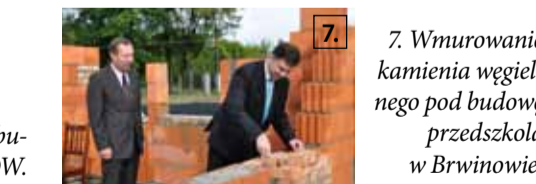
7. Wmurowanie kamienia węgielnego pod budowę przedszkola w Brwinowie.