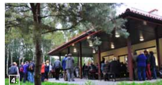
4. Nowa świetlica wiejska w Owczarni. Budowa współfinansowana ze środków UE PROW.