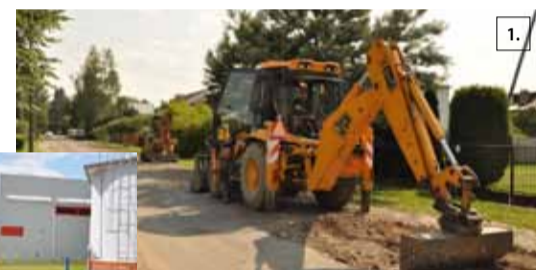
1. Z końcem 2013 r. zakończy się realizacja unijnego projektu „Czyste życie”. Dzięki niemu powstało m.in. ponad 120 km kanalizacji oraz 30 km wodociągów. Zostały też zmodernizowane stacje uzdatniania wody w Brwinowie i Parzniewie.