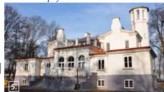
5. Rewitalizacja Toeplitzówki w Otrębusach. Nowa elewacja, rynny, tarasy, schody i plac od frontu, z wygodnym parkingiem: dzięki pozyskaniu środków UE PROW.