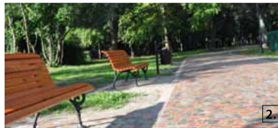
2. Rewitalizacja parku miejskiego w Brwinowie.

Udało się zdziałać bardzo wiele, choć nie wszystkie działania są widoczne dla wszystkich w jednakowym stopniu. Mieszkańcy, którzy już od lat mają kanalizację i wodociąg, nie odczuwają ogromu prac związanych z realizacją „Czystego życia”. Po drodze trzeba było rozwiązać różne problemy i korygować niektóre rozwiązania. Dodatkowo udało się jeszcze rozszerzyć zakres całego projektu i objąć nim m.in. Parzniew oraz osiedle w Otrębusach przy ul. Warszawskiej. Trwa jeszcze budowa kanalizacji w Domaniewie, Domaniewku i Mosznie. Nie wszyscy mają okazję do korzystania na co dzień z wyremontowanych dróg (choćby ulic Czubińskiej i Jasnej, z bezpiecznymi skrzyżowaniami wyniesionymi) lub nowych chodników (np. wzdłuż ul. Książenickiej w Owczarni, gdzie powstał ciąg pieszo-rowerowy). Mieszkańcy miasta raczej nie będą jeździć do Owczarniańskiego Wiejskiego Centrum Animacji, a mieszkańcy wsi – wypoczywać w parku miejskim w Brwinowie... Odwodnienie w Żółwinie (rejon ul. Mokrej, Łąkowej, Nadarzyńskiej) to także jedna z największych gminnych inwestycji minionego roku.